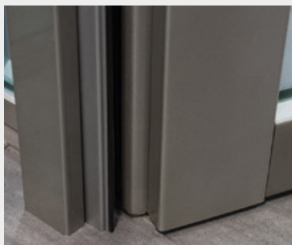
01. Punto de giro