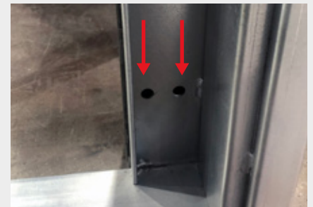
03. Anclaje frontal inaccesible una vez cerrada la puerta con llave