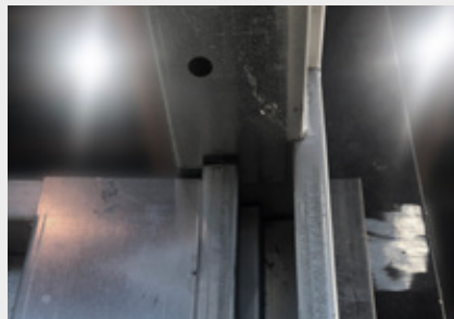
02. Punto de giro sin bisagras